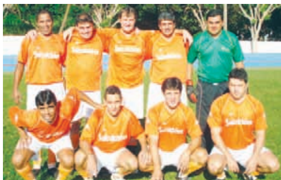
Panamericano, 3 melhor time na Principal