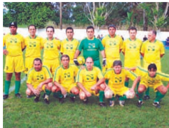
Panamericano, vice-campeão Veterano