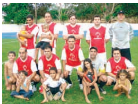
Bradesco Centro - Principal