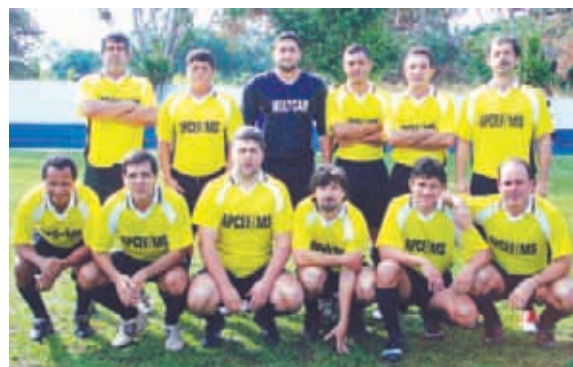
Caixa Econômica Federal, terceira colocada no Veterano