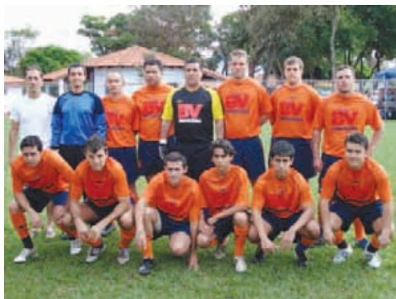
Itaú/BV, vice-campeão na Principal