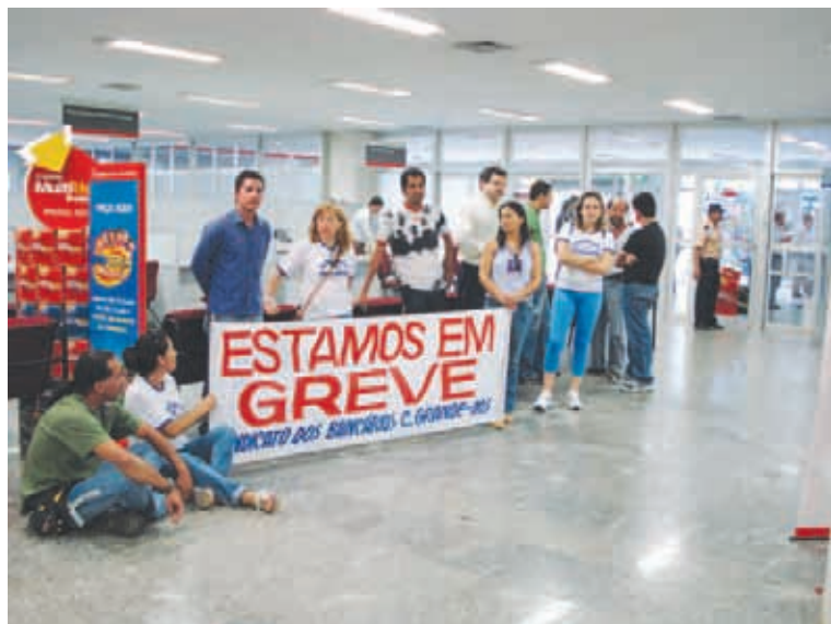
Em 2006, bancários levaram os protestos também para dentro das agências

Levantamento feito com bancários apontará os rumos das negociações a serem estabelecidas entre sindicatos e instituições financeiras