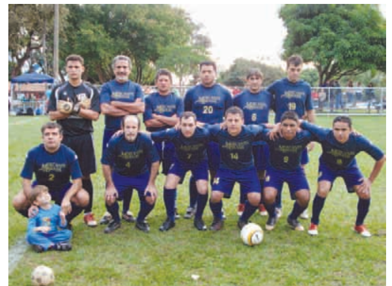
Mercantil do Brasil, campeão no Veterano