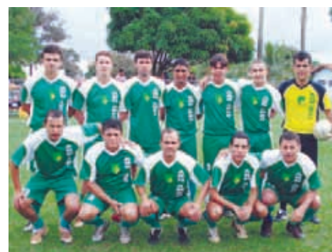
ABN Real - Principal