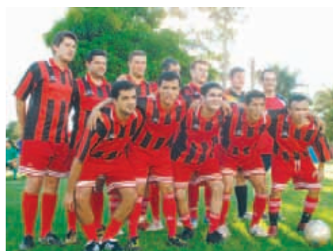
HSBC - Principal