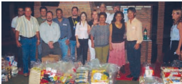
Mais de quatro toneladas de alimentos foram arrecadadas na Festa do Trabalhador

As doações feitas pelos 1,3 mil participantes da Festa do Trabalhador somaram 4.106 kg de alimentos, que foram doados para nove instituições beneficentes de Campo Grande. Todos os produtos arrecadados foram encaminhados às entidades assistenciais pelos Comitês dos Bancários do HSBC, Caixa Econômica Federal, Sudameris e Banco do Brasil. “Um quilo de alimento pode não parecer muito, mas a colaboração individual da categoria irá garantir mais digni-