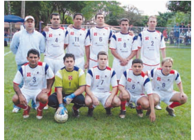
Bradesco Barão, campeão da categoria Principal

O diretor parabenizou todos os participantes pelo espírito esportivo e disposição em participar do campeonato, prometendo novos torneios para os próximos meses.