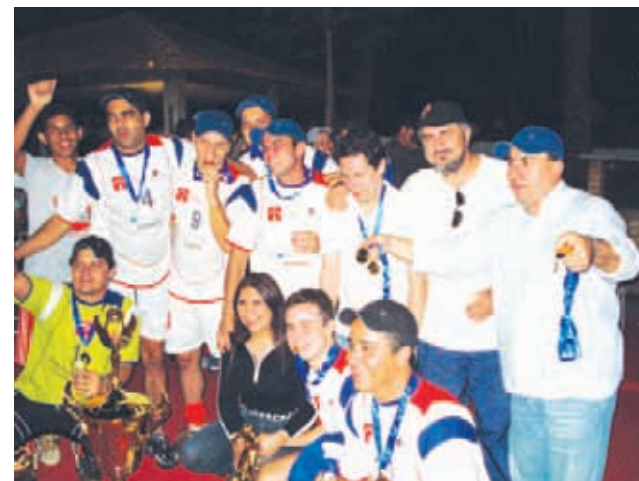
Festa dos campeões