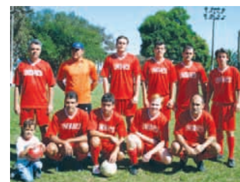
Unibanco - Principal