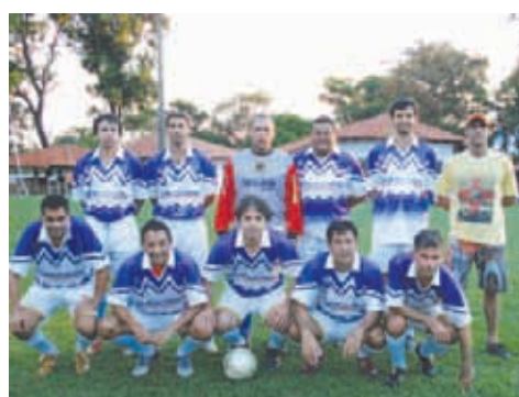
Banco do Brasil - Veterano