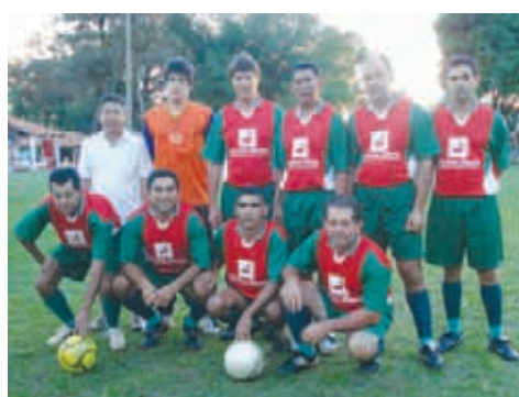
Bradesco Pólo - Veterano