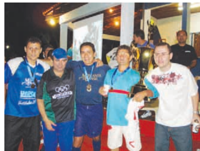
Festa dos campeões